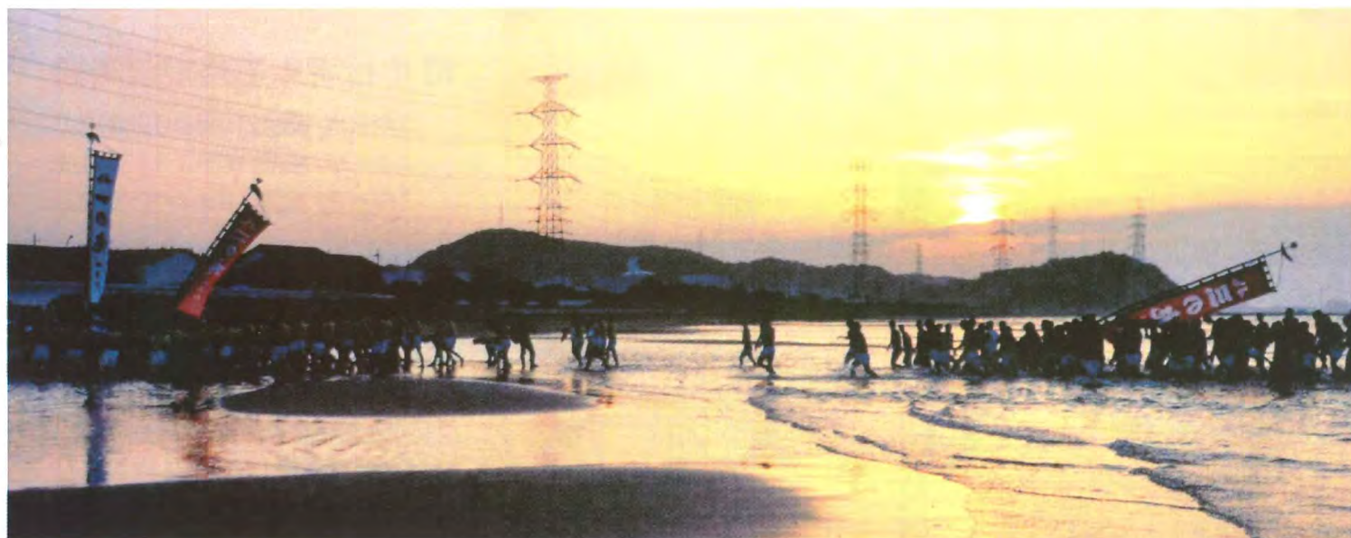
平成22年 潮かきの儀 松原