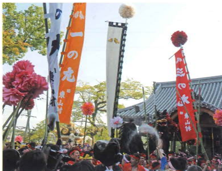
平成24年 潮かきの儀 東山