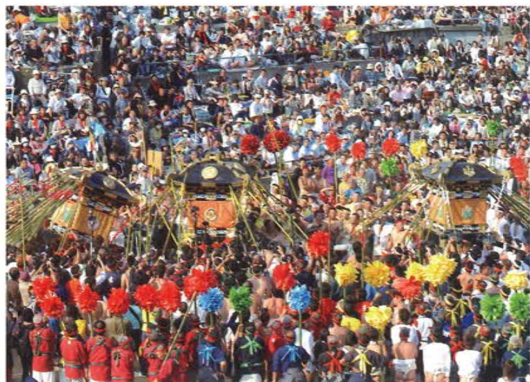
平成24年 神輿練合せ 東山